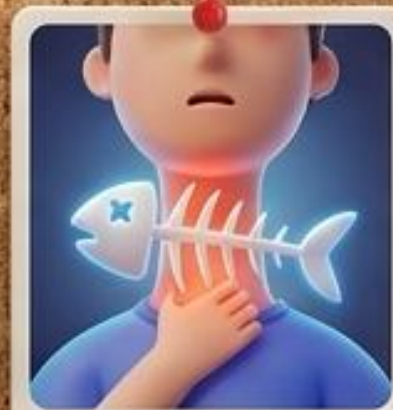
ก้างปลาติดคอ