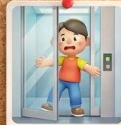
เดินชนกระจก / ลิฟต์หนีบ