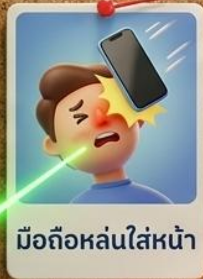
มือถือหล่นใส่หน้า