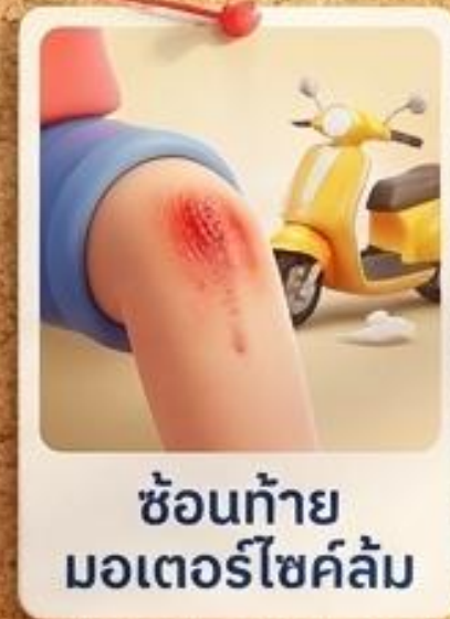
ชอนท้าย มอเตอร์ไซด์ล้ม

PA คู่มครองครบ จบทุกความเสี่ยงในชีวิตประจำวัน!