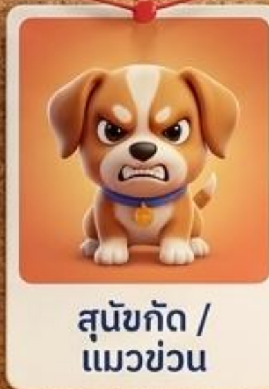
สุนัขกัด / แมวข่วน