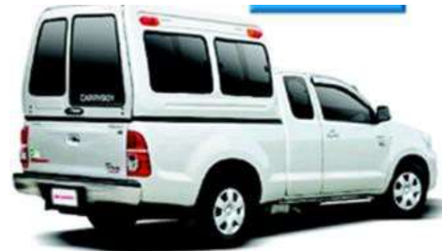
รถเคีรับอยสูง