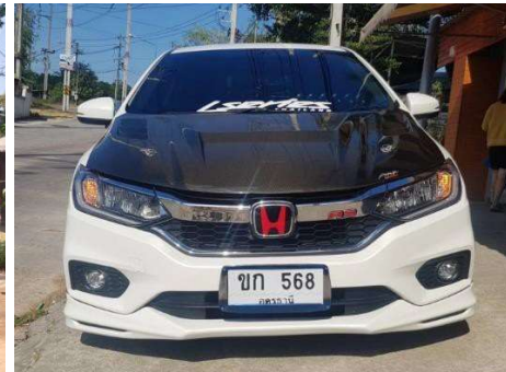
รถดัดแปลงฝากระโปรง