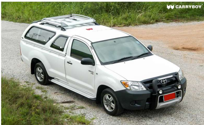
กระบะไม่มีแคป