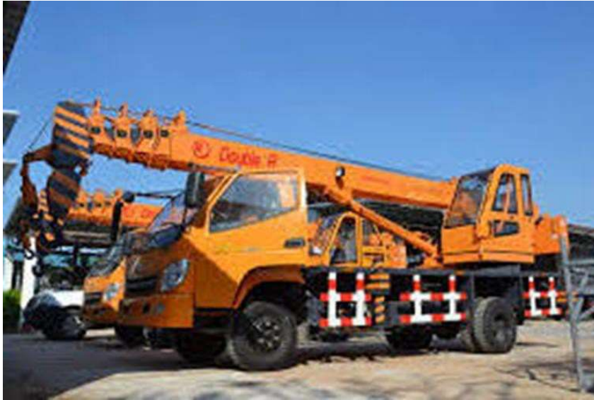
รถเครนใหญ่