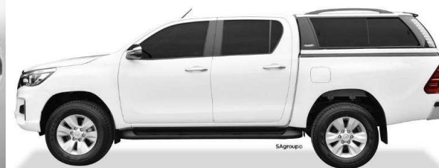
กระบะ4ประตู

ไม่ต้องส่งเช็คเบี้ย สามารถใช้เบี้ยในระบบขายได้ ทุกบริษัท ยกเว้น อลิอันซ์