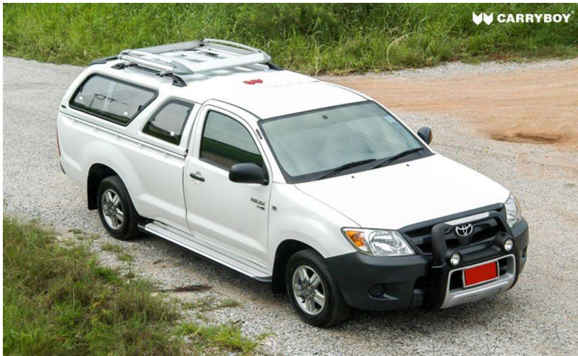
กระบะไม่มีแคป