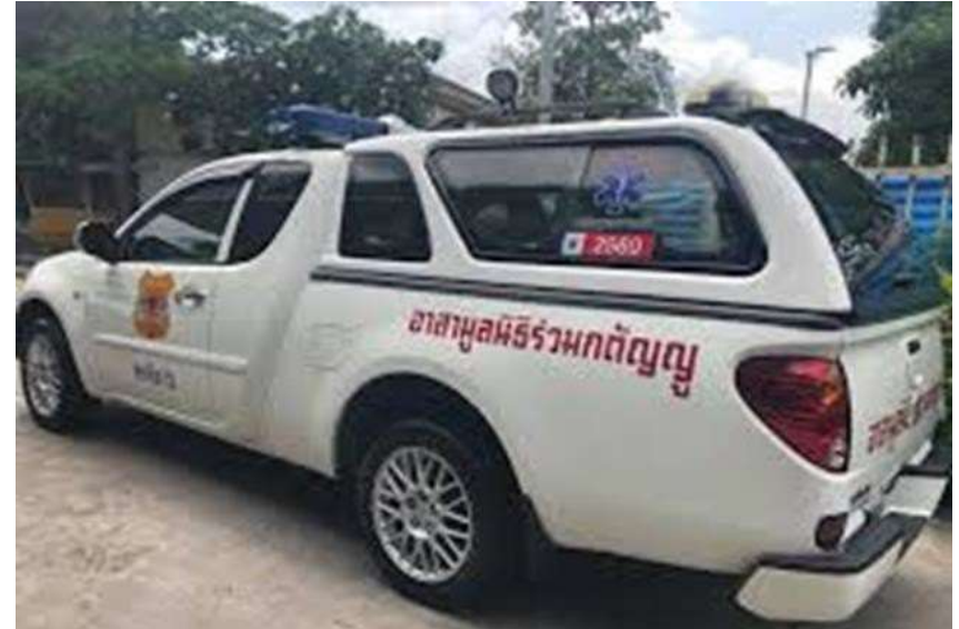
รถมูลนิธิ ติดไซเรน

ไม่มี สามารถทบทวนโบรคเกอร์ ลูกค้าต้องทบทวนภัยโดยตรงกับบริษัท