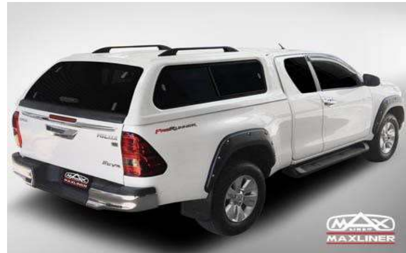
กระบะมีแคป

ไม่ต้องส่งเช็คเบี้ย สามารถใช้เบี้ยในระบบขยได้