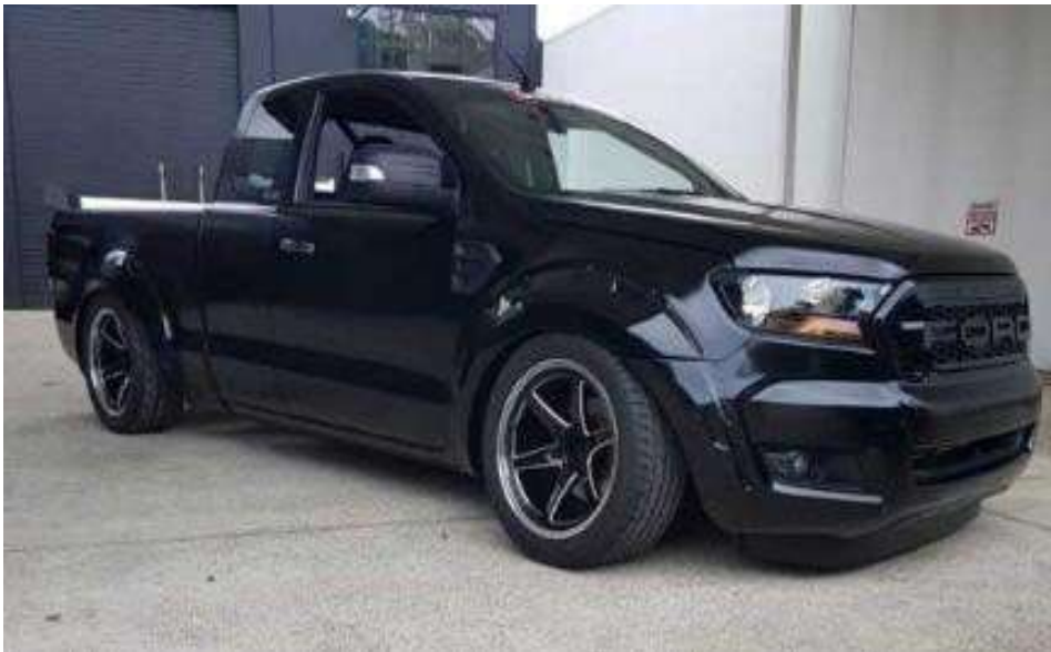
รถโหลดเตี้ย