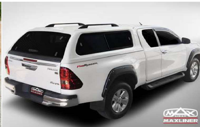
กระบะมีแคป