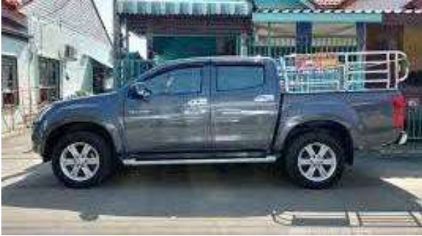
กระบะ 4 ประตู ติดคอก