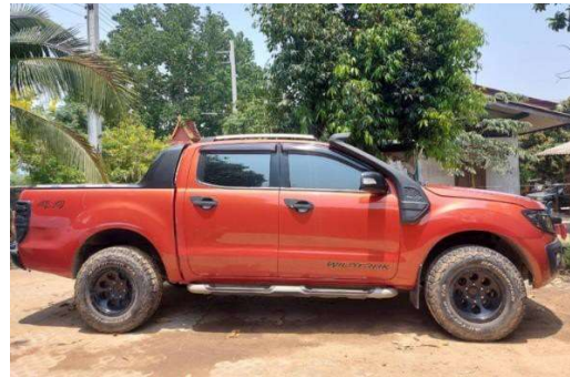
รถติดท่อนวงข้าง